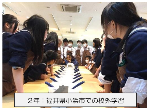
2年：福井県小浜市での校外学習