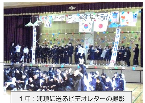
1年：浦項に送るビデオレターの撮影