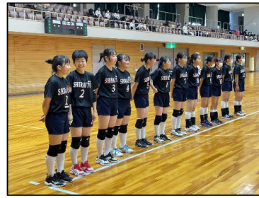
女子バレー ソフトテニス